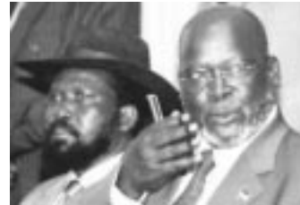
Selva Kiir (g.) du SPLM et le regretté John Garang.