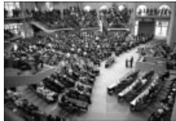
Le Bundestag, Berlin.

Les gouvernements des pays fédéraux ne pourraient être plus différents. Voici, par exemple, le déroulement de deux journées dans quatre capitales fédérales différentes. À Washington, DC, le 2 février 2005, le président des États-Unis, George W. Bush, prononçait son discours annuel sur l'état de la nation lors d'une session commune des deux chambres du Congrès. Le même jour à Ottawa, le premier ministre canadien Paul Martin et les ministres du Cabinet répondaient aux questions acerbes de députés de l'opposition pendant la période des questions. À Delhi, le 25 février 2005, le Parlement indien faisait face à des pressions afin que soit adoptée une loi garantissant 33 pour cent de représentation féminine à la Chambre basse, appelée Lok Sabha. Le même jour au Bundestag à Berlin, la ministre fédérale de la Justice, Brigitte Zypries, défendait les services Internet offerts aux citoyens par son ministère face aux critiques des membres de l'opposition qui prétendaient que les citoyens de l'Autriche — gouvernée par une coalition conservatrice — avaient accès à davantage de services en ligne de leur ministère de la Justice.