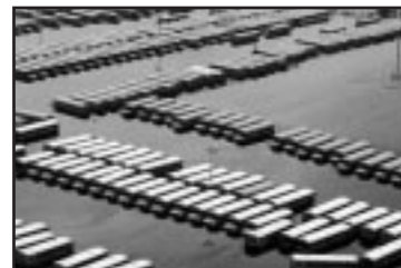
À la suite d'un malentendu entre le gouvernement de l'État et la FEMA, ces autobus n'ont pas été utilisés lors de l'évacuation de la Nouvelle-Orléans.

La FEMA a été créée justement pour passer outre cette confusion. Toutefois, pour être en mesure d'agir en cas de catastrophe, une