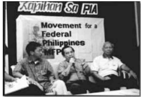
Le sénateur Aquilino Pimentel (au centre) prend la parole en faveur du fédéralisme.