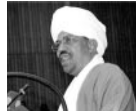
Omar al-Bashir, président du Soudan.

l'Afrique de l'Est composé du Djibouti, de l'Érythrée, de l'Éthiopie, du Kenya, de la Somalie, du Soudan et de l'Ouganda. Le regroupement parraine également des négociations de paix en Somalie et la mise en place d'un parlement somalien en exil.