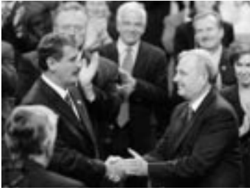
Le président du Mexique, M. Vicente Fox, salue le premier ministre du Canada, M. Paul Martin.

tout comme en Russie (régime semi-présidentiel) et en Autriche (régime parlementaire), le président est élu au suffrage universel direct et seul le nombre de votes obtenus à l'échelle du pays, sans égard à sa répartition géographique, détermine le vainqueur.