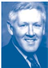
Bob Rae Ancien premier ministre de l'Ontario, Canada Président du conseil d'administration du Forum des fédérations

Organisme novateur, le Forum des fédérations s'est distingué en créant un centre d'échanges international pour les idées touchant au fédéralisme.