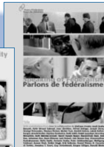
Deux nouveaux vidéos du Forum

Le livre Relations fiscales dans les pays fédéraux est l'un des nouveaux ouvrages publiés cette année par le Forum, en versions française, anglaise, portugaise et espagnole. Le nouvel ouvrage sur les soins de santé dans les pays fédéraux, Federalismo y políticas de salud , a été lancé en espagnol à Mexico. L'art de la négociation a été publié en espagnol pour la première fois sous le titre El arte de la negociación .