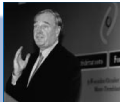
Paul Martin, ancien ministre des Finances du Canada et premier ministre actuel, lors de la conférence inaugurale du Forum à Mont-Tremblant, au Québec

Le Forum espère établir des partenariats avec les gouvernements, les ONG et le secteur privé, de par le monde, pour accroître son rôle dans les champs de la gouvernance fédérale et du règlement de conflits.