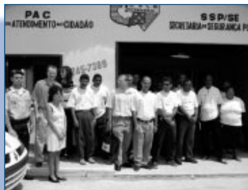
Des chefs de police brésiliens lors de la visite de représentants canadiens de la police et de la justice. Le Forum a également organisé la visite de représentants brésiliens au Canada en mai 2003.