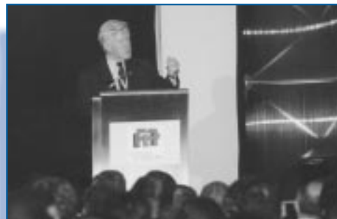
Bob Rae, président du Forum, lors d'une importante conférence du Forum à Veracruz, au Mexique