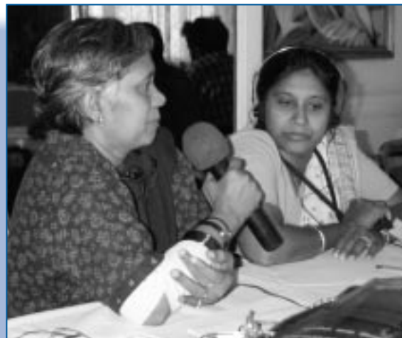
Atelier du Forum au Sri Lanka

Les questions internes des pays fédéraux étaient aussi au cœur du travail du Forum en Asie. Le Forum a fait venir des spécialistes étrangers pour travailler sur la question épineuse du financement et de la prestation des soins de santé dans un État fédéral. À New Delhi, le Forum a participé à l'organisation d'un atelier sur les relations économiques au sein des fédérations, qui rassemblait des participants de tous les coins du pays.