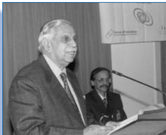
Atelier en Inde dans le cadre du Dialogue mondial