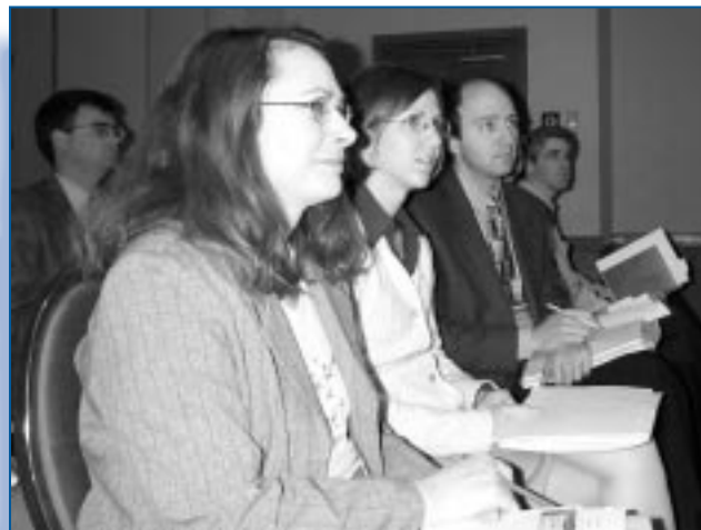
Des praticiens du Canada et d'ailleurs se sont penchés sur la délicate question de la péréquation fiscale lors d'un atelier à Charlottetown, à l'Île-du-Prince-Édouard.

Le service joue un rôle de premier plan au Forum pour mettre en œuvre le système intégré d'information GYST. Ce nouveau système automatisé permettra entre autres aux membres du personnel qui doivent voyager d'avoir instantanément accès, partout dans le monde, à la documentation sur les programmes et aux données financières.