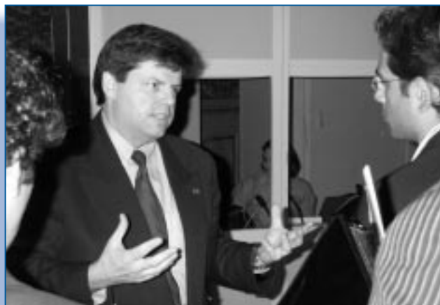
Des étudiants de divers pays s'entretiennent avec Mauril Bélanger, député au Parlement du Canada, lors d'une simulation des Nations Unies à Ottawa, organisée en 2003 avec l'aide du Forum.