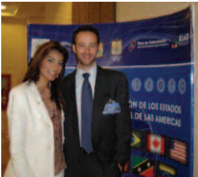
Le Forum a aidé à organiser la première réunion des pays fédéraux des Amériques, qui a eu lieu lors des réunions du RIAD sur la décentralisation, à Torreón, au Mexique.

En novembre 2004, le Forum et son organisme partenaire, la Fondation de l'observatoire de recherche, ont tenu conjointement à New Delhi un atelier de deux jours sur le fédéralisme coopératif et la gestion de la diversité. Parmi les conférenciers invités se trouvait l'ancien juge en chef de l'Inde, E. Ahamdi. L'atelier a traité de plusieurs sujets, notamment les régions du monde où les questions d'identité et d'autonomie ont engendré de la violence et des conflits (comme le Sri Lanka, l'Irak, le Nord-Est de l'Inde) et les exemples de gestion heureuse de la diversité au Canada, en Afrique du Sud et en Inde.