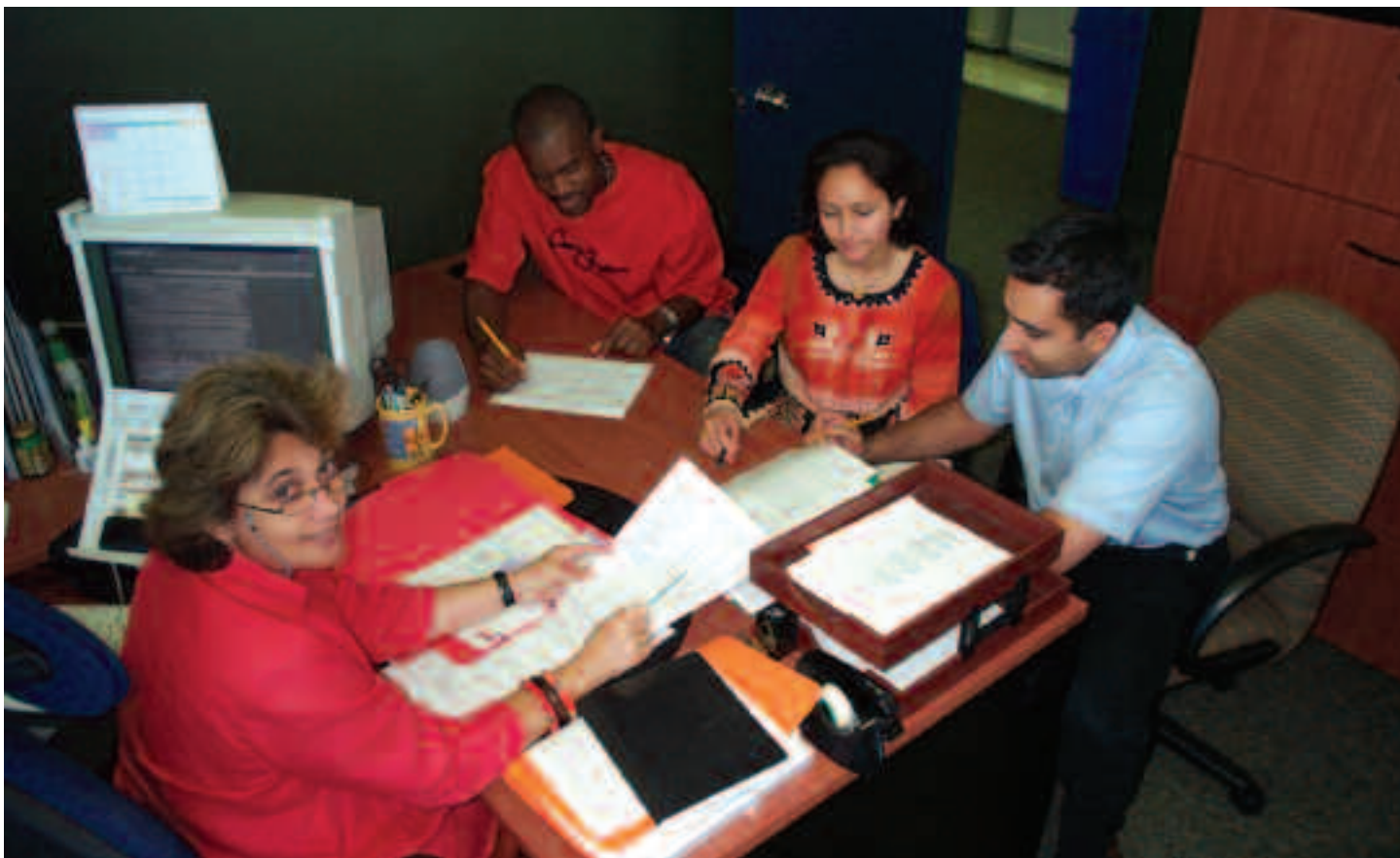
Le personnel de la division des finances, systèmes et opérations du Forum vérifie ici les budgets des projets. La division se charge également des lignes téléphoniques, des services internet et intranet, et du soutien administratif.

En 2004-2005, un plan stratégique financier et opérationnel quinquennal a été mis au point avec la participation du personnel, des administrateurs et des associés. Ce plan a joué un rôle important en vue d'obtenir l'appui des gouvernements partenaires et guidera le Forum dans l'accomplissement de son mandat au cours des cinq prochaines années.