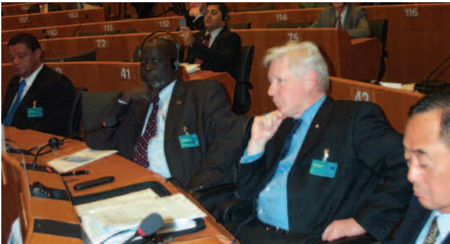
Le président du Forum, Bob Rae (2 e à partir de la droite), s'est adressé aux participants, et a pris part à la mise en commun des expériences lors de la Conférence internationale sur le fédéralisme de 2005, à Bruxelles.

En 1999, à Mont Tremblant, au Québec (Canada), le Forum des fédérations a organisé la première Conférence internationale sur le fédéralisme. À Saint-Gall (Suisse), en 2002, le gouvernement suisse et les gouvernements des cantons ont organisé la deuxième conférence internationale.