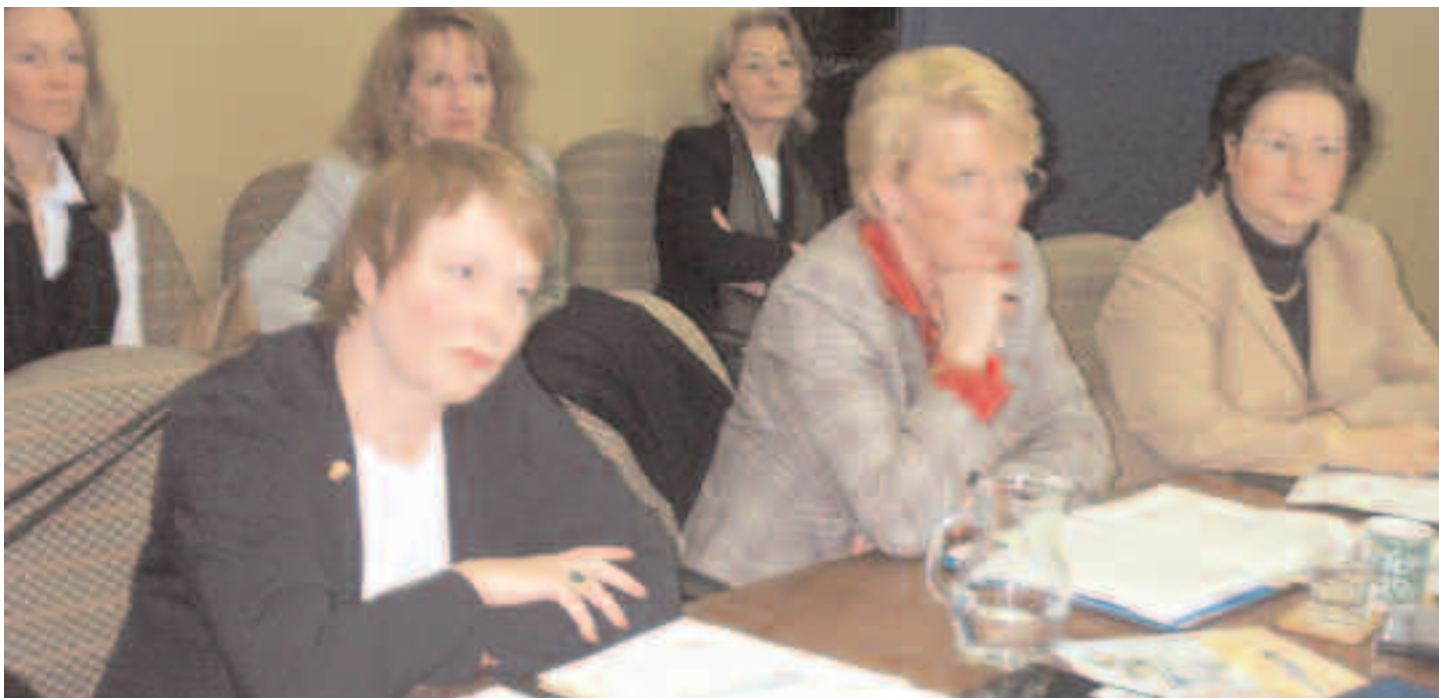
Lors d'une rencontre informelle dans les locaux du Forum, à Ottawa, des représentants des gouvernements, des ambassades et des ONG écoutent des experts venant d'autres pays fédéraux.

Depuis 2000, le Forum a comme partenaires de liaison des institutions dans les pays fédéraux. Les partenaires de liaison du Forum comprennent des instituts, des organismes non gouvernementaux et des agences des pays fédéraux. On y trouve des groupes aussi divers que le Centre pour des politiques alternatives ( Centre for Policy Alternatives ) de Colombo, au Sri Lanka, le Centre d'études constitutionnelles comparées ( Centre for Comparative Constitutional Studies ) de Melbourne, en Australie, l'Institut national pour le fédéralisme et la décentralisation municipale ( Instituto Nacional para el Federalismo y el Desarrollo Municipal , INAFED) de Mexico, ainsi que l'Institut des sciences sociales ( Institute of Social Sciences ) et l'Institut de l'observatoire de recherche ( Observer Research Foundation ) de Delhi, en Inde. Les partenaires de liaison ont participé au travail de traduction du Forum, reçu des stagiaires du Canada pour une durée de neuf mois, donné des avis concernant le travail au sein de leur pays et aidé le Forum à organiser des conférences chez eux.