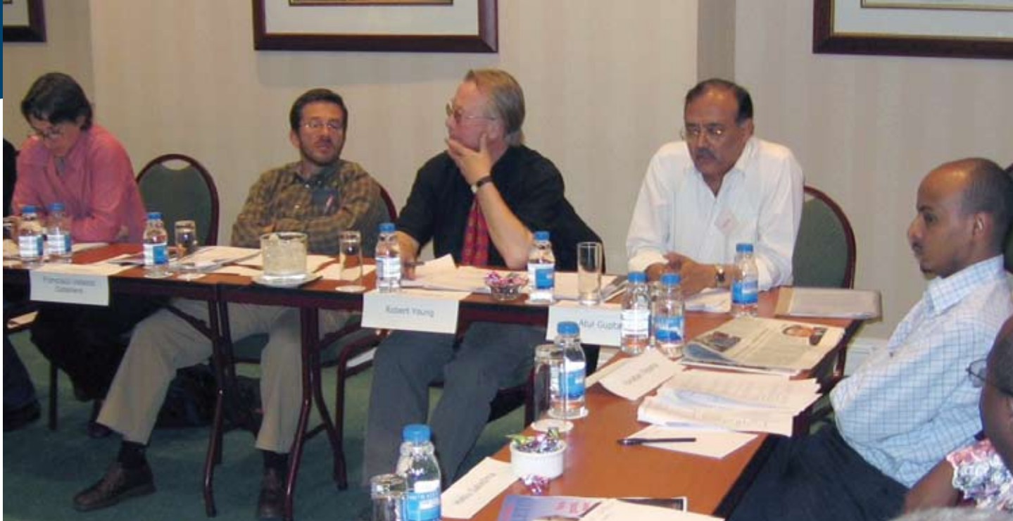
D'éminents politiciens, universitaires et fonctionnaires de tous les coins de la planète échangent sur des enjeux fondamentaux pour les collectivités locales et les régions métropolitaines de pays fédéraux dans le cadre de la table ronde internationale du Dialogue mondial présentée à Johannesburg, en Afrique du Sud, en avril 2007.

présenté à un grand éventail de participants provenant d'O.N.G., du milieu académique, des médias et des assemblées législatives, de même que des gouvernements fédéral, régionaux et locaux. La formation et la sensibilisation représentent des éléments essentiels du programme global du Forum sur la gouvernance fédérale au Soudan, et on y mettra encore plus l'accent à partir de la mi-2008, lorsque s'amorcera la seconde phase du programme de 3,2 millions financé par le ministère des Affaires étrangères et du Commerce international du Canada. La formation intitulée « Les principes fondamentaux du fédéralisme : vers une paix durable au Soudan », qui a été présentée du 28 au 30 avril 2007, expliquait et démystifiait le modèle fédéral de gouvernance. Elle se penchait sur des thèmes classiques du fédéralisme comparé et s'appuyait sur les connaissances et l'expérience des participants en tant que chef de file de leurs organisations et professions. La formation s'articulait autour de conférences et de discussions sur les principales caractéristiques des fédérations — y compris les nouveaux aménagements des accords de paix du Soudan et de la Constitution nationale intérimaire. La formation était dirigée par Peter Meekison, Ph.D., du Canada, et Omer Awadalla Ali, Ph.D., du Soudan. Shawn Houlihan, directeur des programmes en Afrique du Forum, a agi en tant que facilitateur de l'activité.