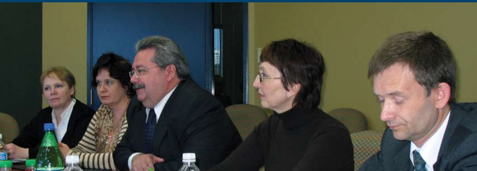
Des experts fédéraux russes en matière de politique et d'administration fiscales discutent d'enjeux fiscaux dans les bureaux du Forum des fédérations en novembre 2007.