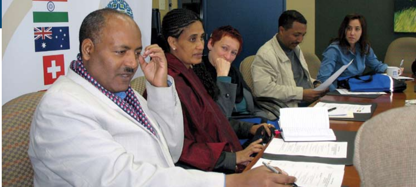
Des membres de la délégation éthiopienne de la Chambre de la fédération – le Sénat de l'Éthiopie – discutent de fédéralisme dans les bureaux du Forum en octobre 2007.