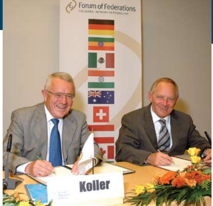
Arnold Koller, président du conseil d'administration du Forum, et le ministre de l'Intérieur allemand, Wolfgang Schäuble, Ph.D.

Tout comme les programmes de gouvernance, les programmes mondiaux du Forum débordent d'activités. Ils ont lancé le quatrième volume de la série du Dialogue mondial, The Practice of Fiscal Federalism: Comparative perspectives dans le cadre de la Quatrième conférence