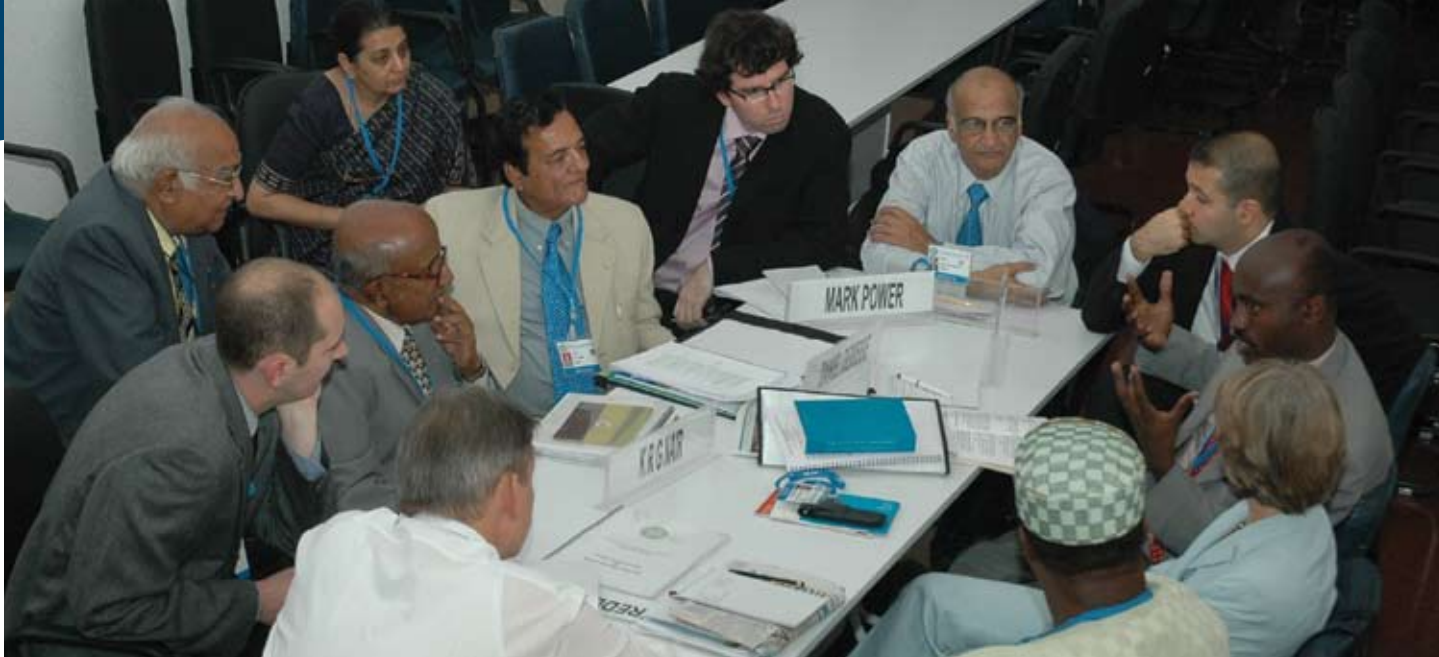
À New Delhi, en novembre 2007, un groupe de discussion débat d'une question liée aux pratiques fédérales dans le cadre de la 4 e conférence internationale sur le fédéralisme.