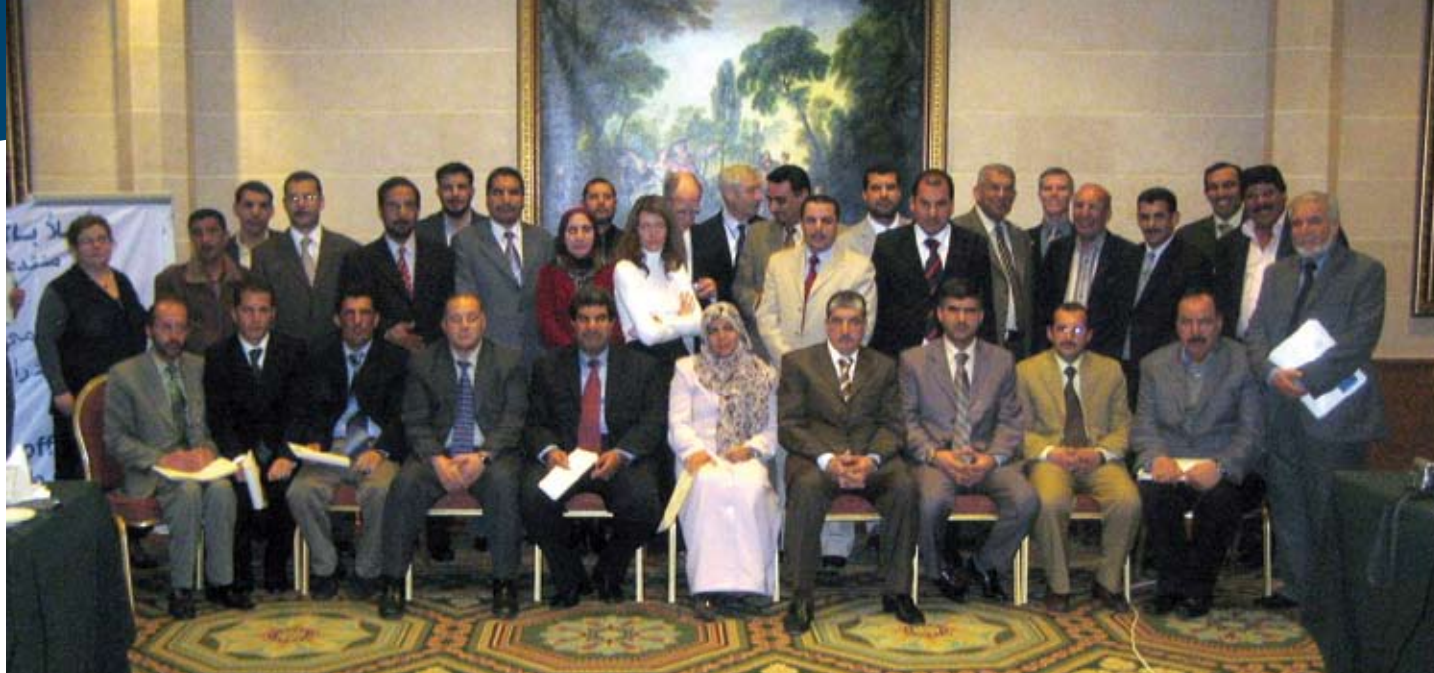
La troisième formation sur le fédéralisme du Forum des fédérations dispensée en février 2008 à Amman, en Jordanie, a fourni à ses participants irakiens une solide base en matière de relations intergouvernementales.