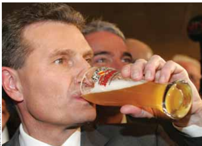
Налог на пиво — одна из немногих независимых доходных статей региональных правительств ФРГ. Пиво пьет Гюнтер Эттингер, премьер земли Баден-Вюртемберг, христианский демократ и сопредседатель объединенной парламентской комиссии по реформированию системы налогово-бюджетного федерализма в Германии.

Налогово-бюджетный федерализм в ФРГ также отличается весьма сложной системой финансовых компенсаций, призванной создать сопоставимый уровень жизни для населения всей страны, как того требует немецкая конституция. После первоначального распределения доходов все земли получают дотации,