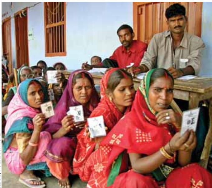
Женщины в очереди на избирательном участке показывают приглашения на выборы, г. Патна на востоке Индии. Миллиону женщин гарантированы места в сельских советах или «панчаятах» в соответствии с поправкой к индийской конституции.

В ходе диверсификации отношений в рамках национального государства и обеспечения того, чтобы культурные и этнические различия не стали поводом для неравенства отдельных частей населения, важную роль играло значение той или иной территории. Кроме того, различные группы не воспринимают друг друга как выше- или нижестоящих. Индийская государственность основывается на духе общности, обеспечивающем сосуществование разнообразных групп в рамках одной страны. Признание плюрализма важной ценностью сделало возможным укрепление как справедливости, так и самобытности в рамках единой политической системы.