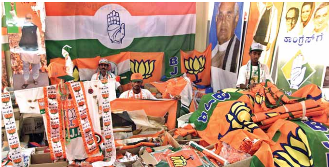
Производители знамен, флагов и эмблем политических партий демонстрируют свою продукцию перед отправкой ее на избирательные участки из мастерских Бангалора.

Индийский федерализм изобилует парадоксами