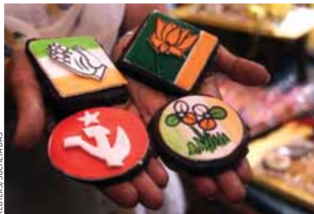
Во время предвыборной кампании в Индии продается печенье с партийной символикой. По часовой стрелке, начиная с верхнего левого угла: Индийский национальный конгресс, Индийская народная партия, Тинамул Конгресс и Коммунистическая партия Индии (марксисты).

Покрытую горами, джунглями и равнинами Индию, где официальными признаны 22 языка, проживает 1,1 млрд человек, соседствуют более пяти религий, трудно представить себе с иной формой правления, кроме федеративной. Если бы в конституции Индии отсутствовали положения о федерализме, скорее всего, она должна была их принять, чтобы выжить. За последние 60 лет федерализм изменил основы индийской политики.