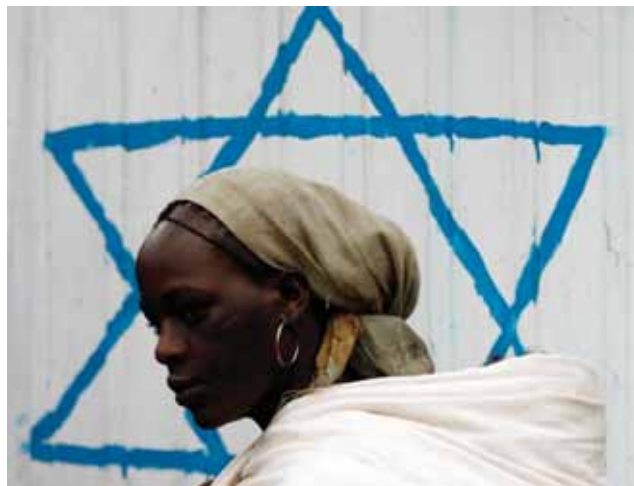
Эфиопская женщина идет в синагогу в Аддис-Абебе в начале Рош-а-Шана — еврейского Нового Года, в сентябре 2007 г.

по этнолингвистическому принципу, и двух федеральных городов с особым статусом — Аддис-Абеба и Дыре-Дауа. К числу девяти штатов относятся Афар, Амхара, Бенишангуль-Гумуз, Гамбелла, Харари, Оромиа, Эфиопское Сомали, Тыграй и Штат народов и народностей Юга.