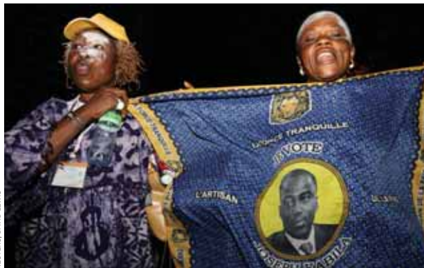
Сторонники президента Жозефа Кабила празднуют в Киншасе его победу на выборах (Демократическая Республика Конго, ноябрь 2006 г.).

После продолжительной войны и долгого мирного процесса был разработан и одобрен проект новой конституции, и в 2006 г. были проведены выборы. Новая конституция представляет собой компромисс между федералистами и централистами. Эта конституция имеет некоторые унитарные положения: центральное правительство обладает функцией надзора за децентрализованными территориальными образованиями, а президент страны имеет право назначать губернаторов и вице-губернаторов регионов. Элементы федерализма можно усмотреть и в разделении прерогатив между центральным правительством и провинциями, а также в административной автономии провинций.