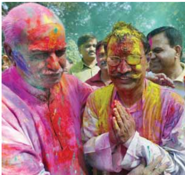
Партийные руководители из законодательных органов власти штатов и центра разделяют общее веселье после обливания подкрашенной водой на празднике Холи, отмечаемом в марте. Назначенный губернатор штата Уттарханд Б. С. Хандури (справа) улыбается, когда известный индийский оппозиционер Л. К. Адвани, приглашает его пройти вперед.

Несмотря на очевидные проблемы, с которыми сталкивается федеральный политический курс, многие спорные вопросы успешно решаются на основе действующих институциональных договоренностей. Есть и другой повод для оптимизма. Центральное правительство недавно признало необходимость превращения Ай-Эс-Си в более эффективное средство обсуждения основных социально-экономических проблем. В нынешний период коалиционной политики появится еще больше возможностей, которые помогут Индии достичь подлинно кооперативного федерализма.