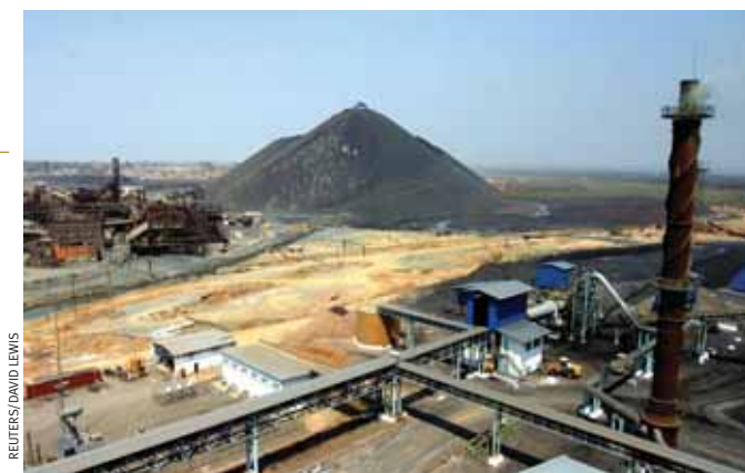
Богатство, ставшее причиной войн: меднорудный комбинат возвышается над городом Лубумбаши в провинции Катанга (Демократическая республика Конго).

В 2006 г. ПОСЛЕ КРОВОПРОЛИТНОЙ пятилетней гражданской войны, закончившейся в 2003 г., в Демократической Республике Конго (ДРК) были проведены первые за 40 лет свободные выборы, и теперь в республике создаются предпосылки для разделения власти между 26 провинциями и определяется статус четырех государственных языков.