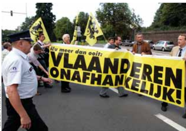
Марш протеста у резиденции бельгийского короля Альберта II в Брюсселе в августе с плакатом «Независимость Фландрии теперь нужнее, чем когда-либо».

ального обеспечения регионам. Фландрия хотела бы передать под региональный контроль не только сэкю. Недавно бывший фламандский министр Эрик Ван Ромпюи отметил, что «новый курс» необходим для передачи контроля над бельгийскими «экономическими рычагами» региональным правительствам. В статье на сайте сепаратистской партии Флаамс Беланг утверждается, что в 1999 г. Фландрия финансировала 64% общенационального фонда социальных пособий, а получила обратно менее 57,6%.