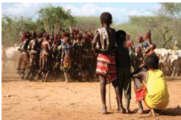
Мальчики народа хамер — одной из 85 эфиопских этнических общин, наблюдают за ритуальными прыжками через быка в нижней долине Омо.