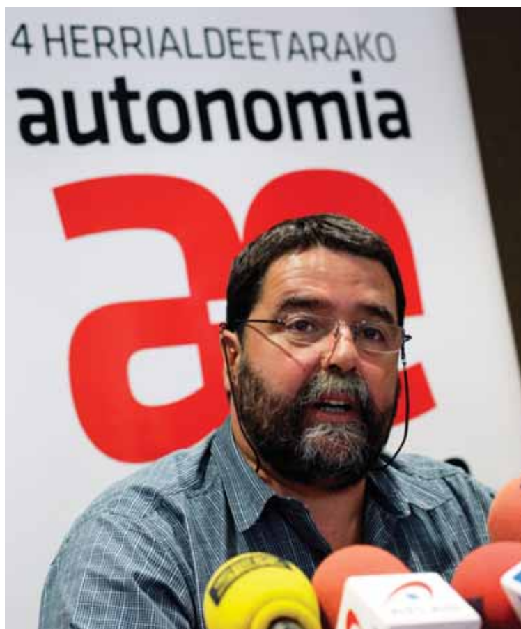
Представитель Батасуны — нелегальной Партии независимости басков, выступает на пресс-конференции в Сан-Себастьяне в сентябре.

жение, сброс водных и жидких отходов, вывоз мусора, подъездные пути и санитарные службы. Для решения этих проблем у них есть три возможности: позволить предоставлять эти услуги провинциальным правительствам, сформировать особый район по предоставлению услуг совместно с ближайшими муниципалитетами, либо заключить договор с правительством другого муниципалитета или частным поставщиком услуг. Каждый из этих вариантов по характеру является межправительственным, и все они нуждаются в одобрении автономной общины. По таким вопросам, как выбор места для строительства новых школ, муниципалитеты взаимодействуют с чиновниками сферы образования в автономных общинах.