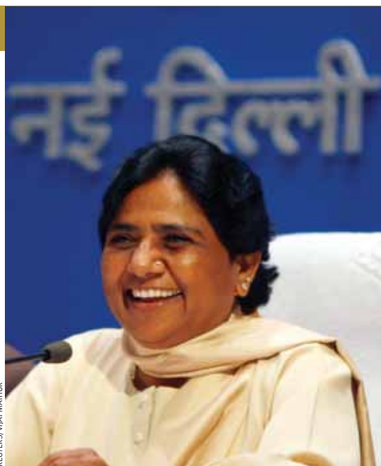
Представительница касты «неприкасаемых» стала губернатором северного индийского штата Уттар-Прадеш. Майавати Кумари, лидер партии Бахуджан Самадж - партии Далитс или «неприкасаемых», пришла к власти в штате после победы ее партии в мае.

отдельных групп населения в неоднородном обществе, она остается лишь мажоритарной демократией, в рамках которой права меньшинств ущемляются. Поскольку мажоритарные процедуры и институты могут поставить меньшинства в невыгодное положение, индийская конституция предусматривает особые положения по защите прав меньшинств и предоставлению им равных групповых и индивидуальных прав.