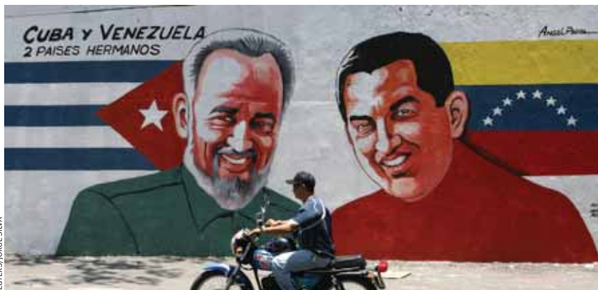
Настенная роспись в Каракасе изображает Фиделя Кастро и Уго Чавеса. Надпись гласит: «Куба и Венесуэла — два братских государства».