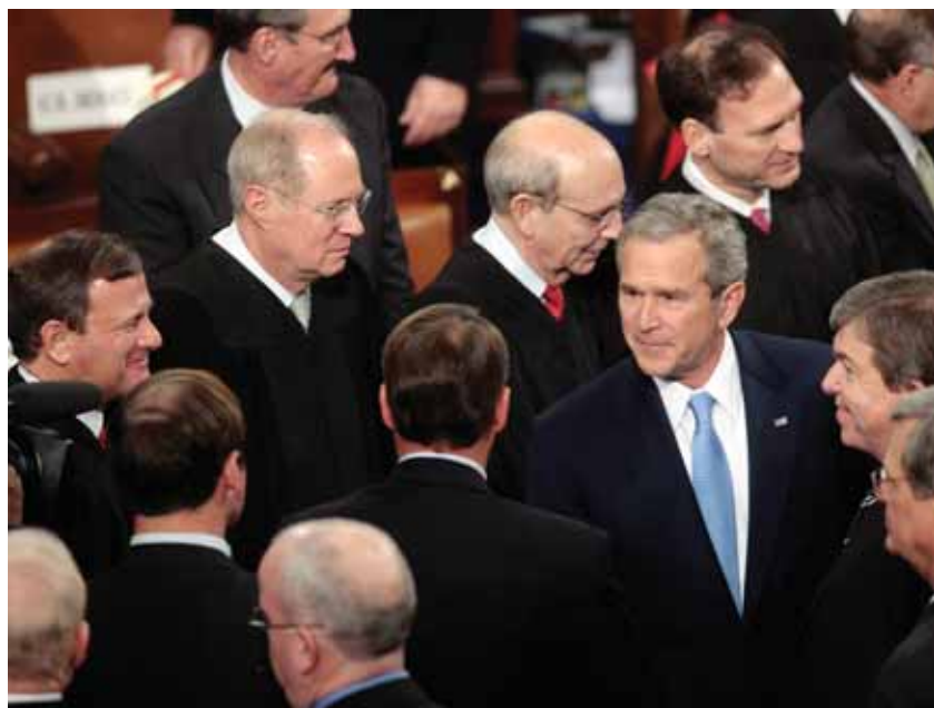
Президент Джордж У. Буш в окружении четверых членов Верховного суда после ежегодного послания Конгрессу США, январь 2007 г. Слева направо: судьи Джон Робертс, Энтони Кеннеди, Стивен Брейер и Сэмюэл Аливо.